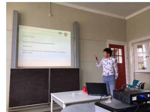
Workshop: Een goed ondernemersplan opzetten