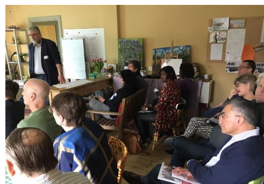
Workshop Bestuursmodellen voor het runnen van je buurthuis