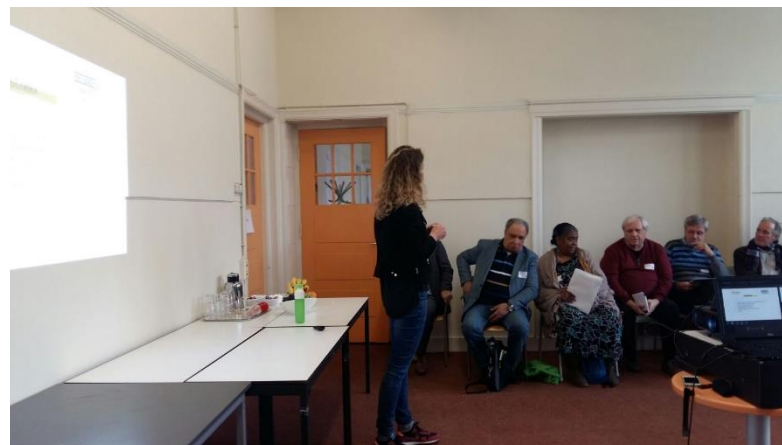
Workshop Crowdfunding en andere financiering